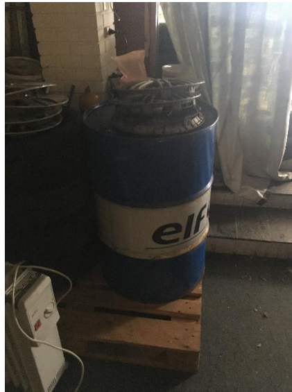
Tromle til opbevaring af spildolie