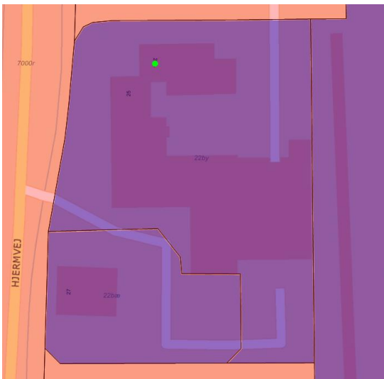
Figur 1 Forureningskortlægning (lilla = V1; områdeklassificering = orange)

Ejendommen er kortlagt som muligt forurenede grund (vidensniveau V1).