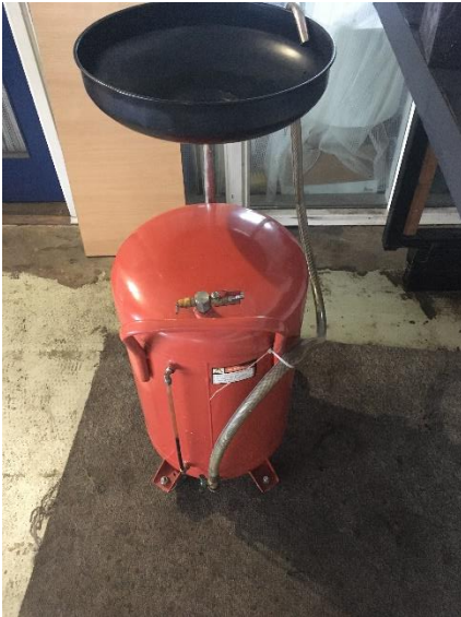
Opsamlingsstank til spildolie