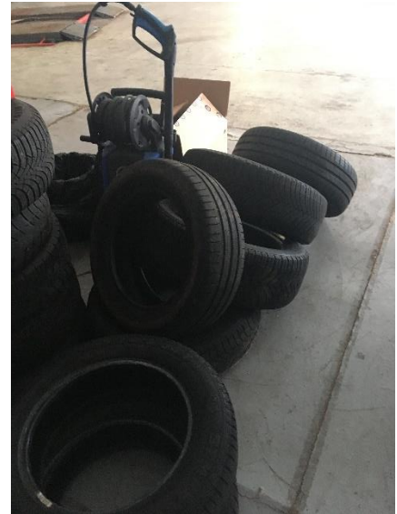
Dækaffald indendørs på værkstedet