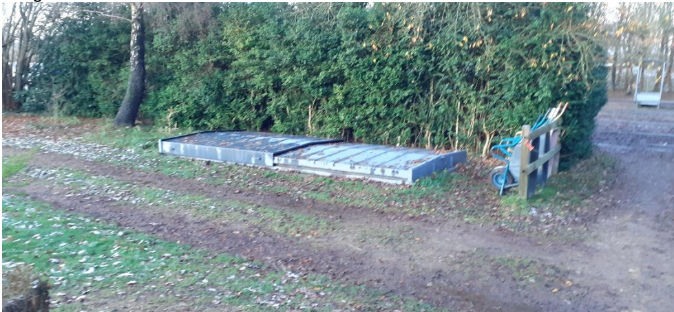
Foto nr. 1. Nedgravet container til husdyrgødning.

Der er nedgravet en overdækket container til husdyrgødning. Containeren er nedgravet i 2018. Se foto nr. 1