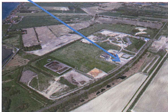
Pladsen set fra "syd-øst"-lige hjørne.

REFA har i 1999 fået miljøgodkendt indretning af plads til mellemlagring brandbart affald i Miljøcenter Hasselø's sydøstlige hjørne. Denne plads ønskes nu godkendt til mellemlagring og neddeling af imprægneret træ. Placering vist på nedenstående luftfoto.