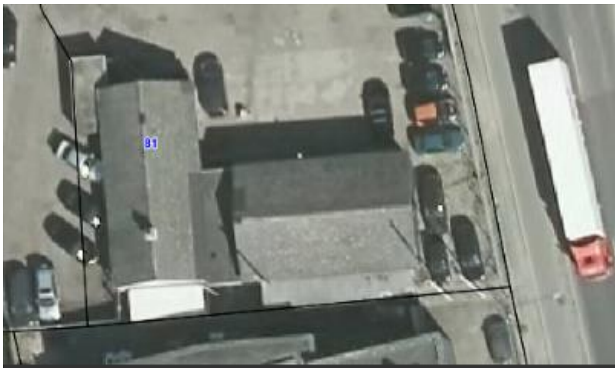
Luftfoto af ejendommen med matrikelskel anno 2019

I forhold til kommuneplanen ligger virksomheden i erhvervsområde 160513ER. Der ligger enkelte boliger i området, og virksomheden ligger mindre end 100 meter fra nærmeste bolig.