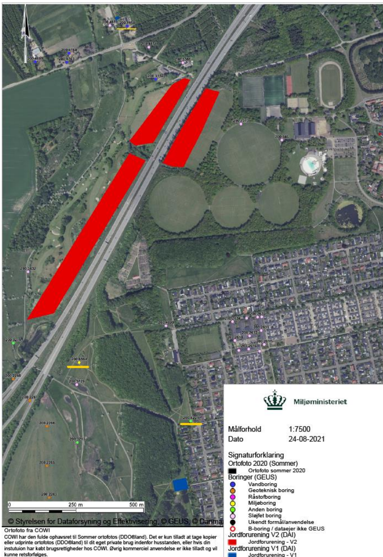
Billede 1 Oversigtskort med støjvoldene skraveret ved rød. Prøvetagningsboringer er understreget med gul.