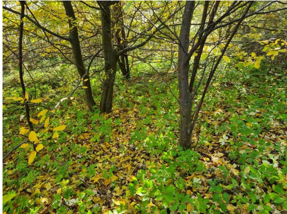
Billede 2 Støjtoldene fremstår tæt bevokset med træer og mindre planter og græs.