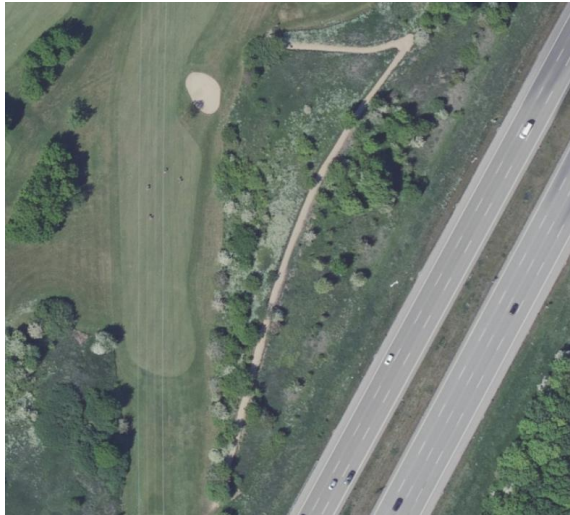
Billede 3 Oversigtskort - rød firkant er placering af en grussti, anlagt i forbindelse med den tilstødende golfbane.

På støjtolden er blevet anlagt en grussti. Grusstien er blevet anlagt i forbindelse med den tilstødende golfbane. Slutafdækningen skal bestå af 1 meter jord, hvor mindst de øverste 30 cm skal være muldjord, jf. vilkår 7 af godkendelse 19. august 1980. Miljøstyrelsen tager stigen til efterretning, da slutafdækningen under gruset stadig overholder gældende vilkår, og grusstien, med sin størrelse og udformning, ikke vurderes at forhindre gennemtrængning af regn- og overfladevand.