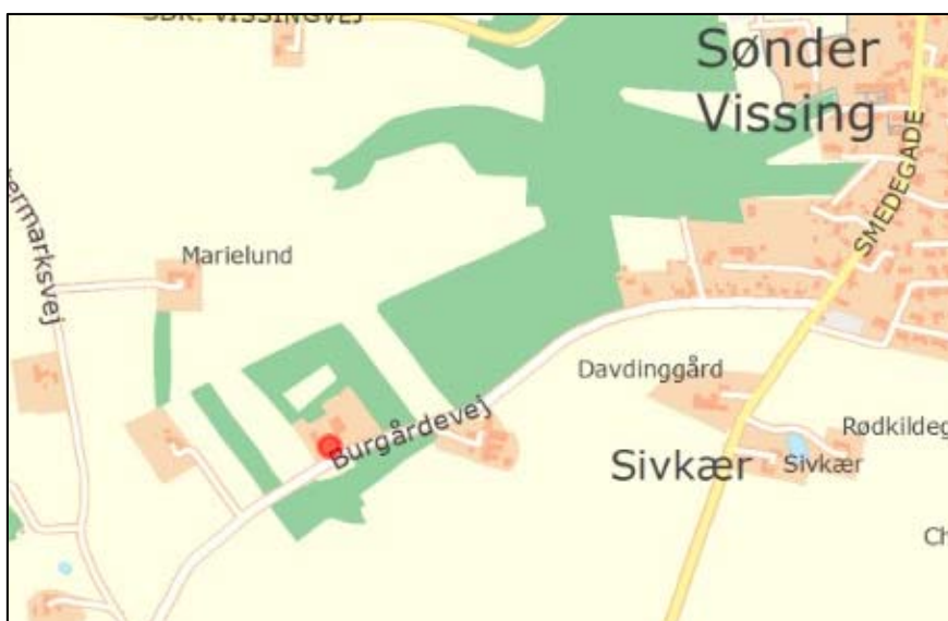
Figur 1: Oversigtskort med Burgårdevej 30, 8740 Brædstrup (rød prik). Område omfattet af miljøgodkendelsen fremgår af bilag 1.

Denne afgørelse erstatter afgørelse nr. 2 og 3 ovenfor. Landzone tilladelser (afgørelse 1 og 4) er ikke ændret med denne afgørelse.