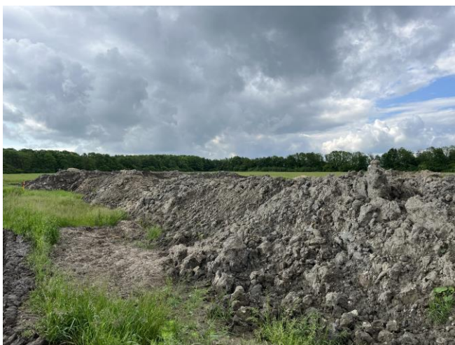
Jordbunker placeret på deponi