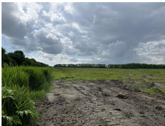
Foto til venstre: Grøft, der udgør den nordlige grænse af deponiet. Deponiet ligger til højre. Foto til højre: Deponiet til højre og bevoksning mod grøft til venstre.