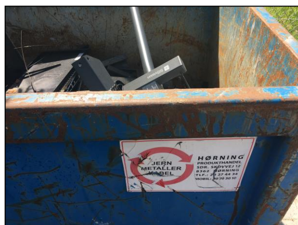
Foto af udendørs container til opbevaring af metalaffald, der tømmes af Hørning Produkthandel.