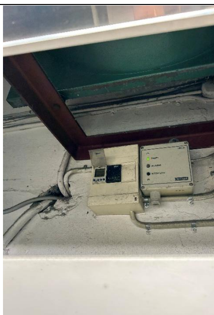
Figur 5: Ventilationstæller