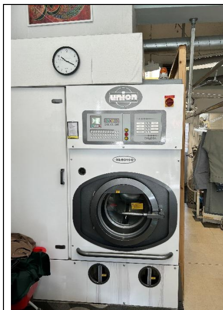
Figur 2: Rensemaskine