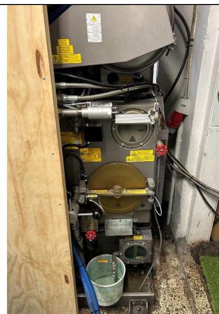
Figur 3: Rensemaskine placeret på spildbakke.