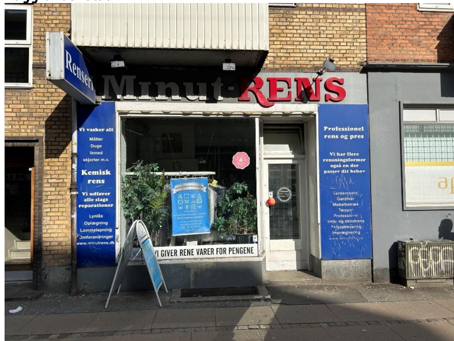
Figur 1: Renseri er beliggende på Frederikssundsvej i en boligejendom.