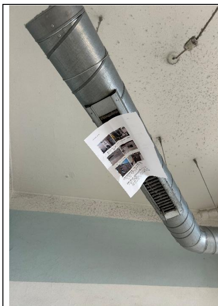
Figur 4: Papirtest