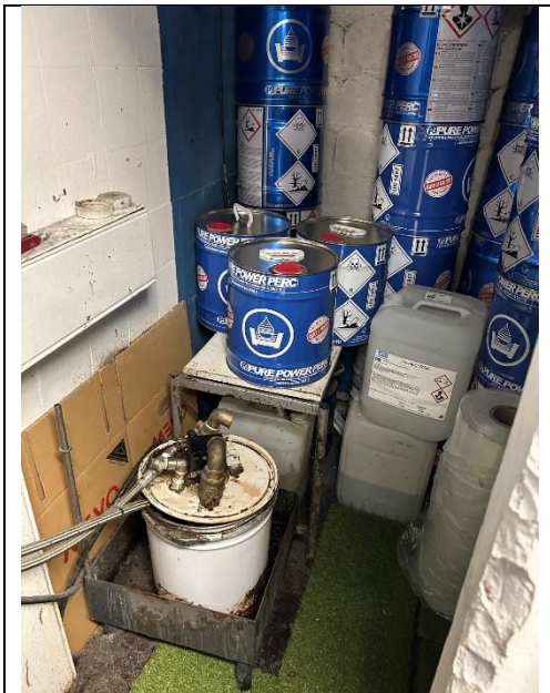
Figur 7: Opbevaring af rensesvæske.

Rensevæske er opbevaret vådrum uden afløb, som fungerer som spildbakke.