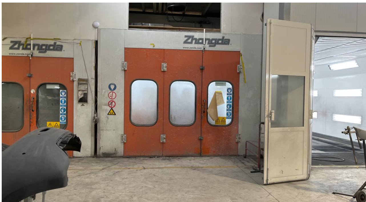
De ialt 3 sprøjtekabiner - den nyeste er placeret helt til højre (hvid dør).