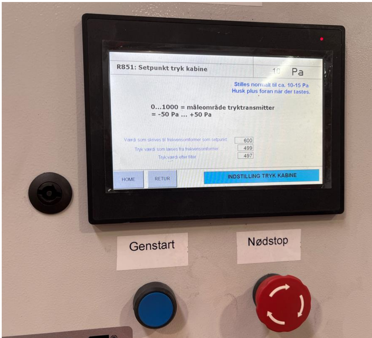
Sprøjtekabinerne er forsynet med elektronisk overvågning af trykfaldet over tørfiltrene (differenstrykmåler).